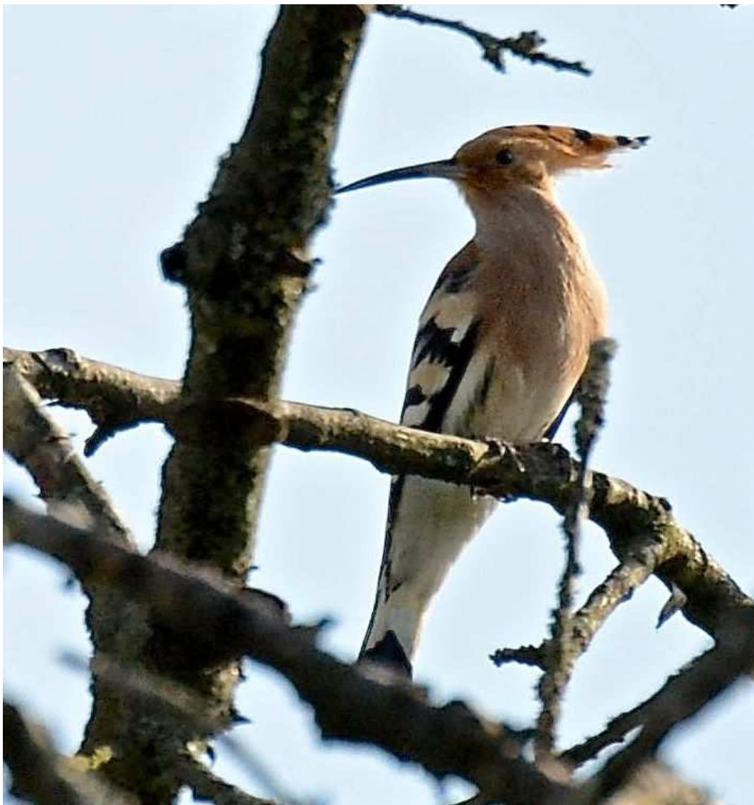
Zählte zu den auffallenden Vogelarten im Jahr 2014: Wiedehopf Upupa epops auf dem Gailenberg bei Mühlheim.