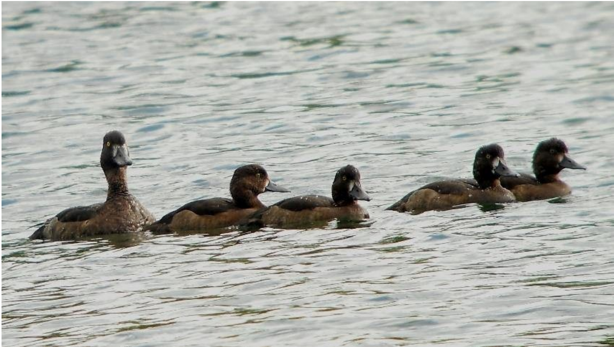
Am 25. August sind die Jungen fast erwachsen und unterscheiden sich von der Mutter (links) fast nur noch durch die nicht intensiv gelb gefärbte Iris.

Seit einigen Jahren zeichnet sich ein Rückgang der überwinternden Vögel ab. Dies lässt sich aus folgendem Diagramm mit den Ergebnissen der Wasservogelzählungen in drei Gebieten ablesen.