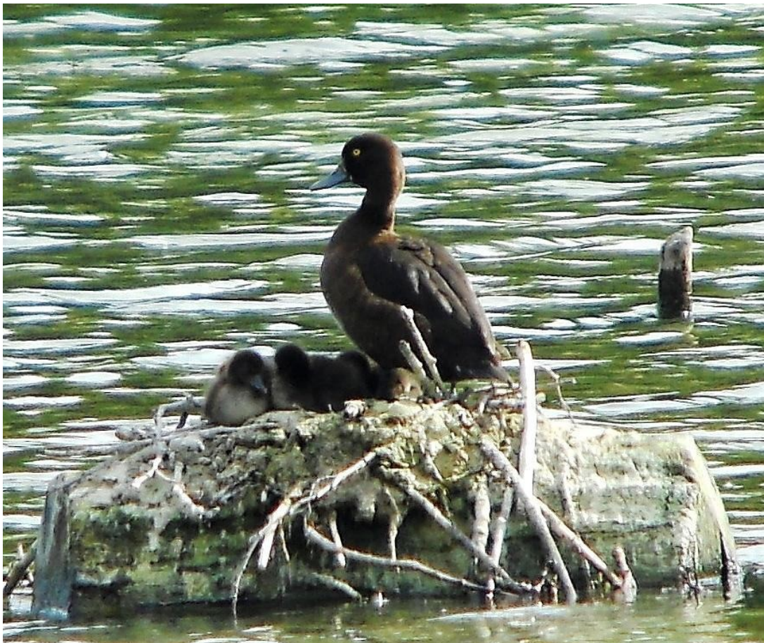
Reiherente mit Küken, Angelweiher Obertshausen

Erst im Jahr 2010 glückte auf dem Angelweiher bei Obertshausen wieder ein Brutnachweis: Ein Weibchen führte am 17. Juli fünf wenige Tage alte Küken. Die Familie hielt eng zusammen, so wie auch in den folgenden Wochen. Am 11. August waren nur noch vier Jungvögel zu beobachten; diese wurden flügge.